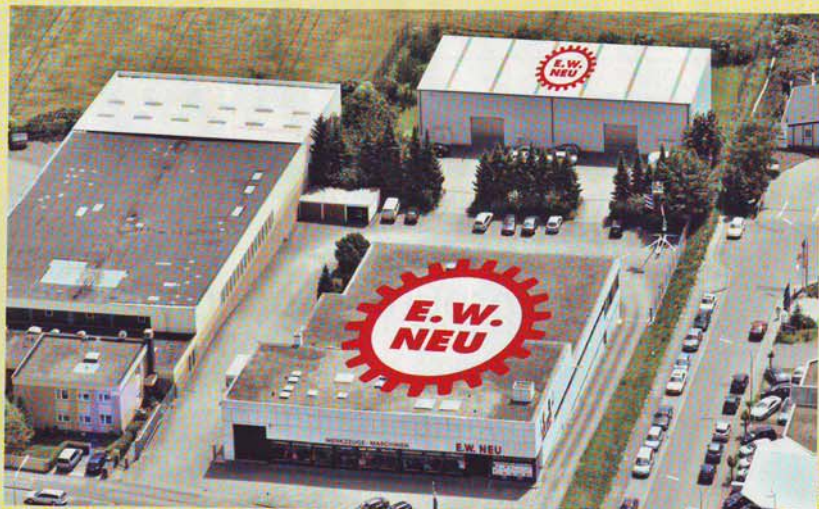
Der Werkzeugmaschinen-Showroom des Wormser Maschinenhandelshaus E. W. Neu GmbH befindet sich in der weißen Halle (oben im Bild).

Mit seinem neuen Ausstellungsraum will das Wormser Maschinenhandelshaus, das als Werksvertretung für verschiedene Werkzeugmaschinenhersteller fungiert, dem Kunden seine Kompetenz in Sachen Werkzeugmaschine noch besser vermitteln. Zu den Highlights des Showrooms gehören unter anderem konventionelle Drehmaschinen des deutschen Herstellers GDW Werkzeugmaschinen mit Sitz in Herzogenaurach. Diese Maschinen kommen in vielen Unternehmen vor allem für Ausbildungszwecke zum Einsatz. Vorführbereit sind außerdem Drei- und Fünf-Achs-Bearbeitungszentren von Alzmetall sowie Hardinge/Bridgeport. Die E.W. Neu GmbH, die heute rund 50 Mit-