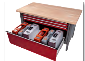
Abb. zeigen XXL Schubladen 1200 x 600 mm ( B x T )