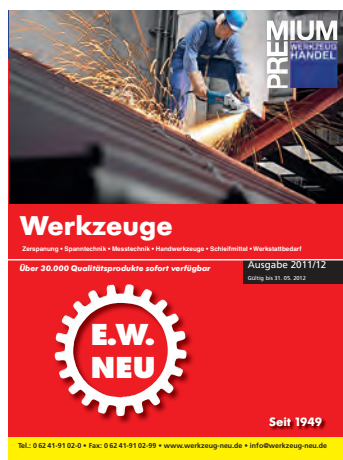
Premium Werkzeuge 2011/2012

Unsere neuen Kataloge seit dem 01.05.2011 für Sie verfügbar!