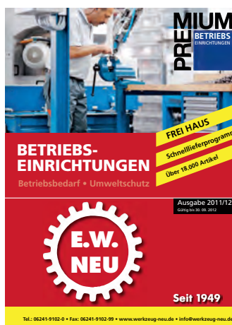
Premium Betriebseinrichtungen 2011/2012