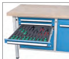
Abb. Preis ohne Inhalt. Mögliche Einsätze