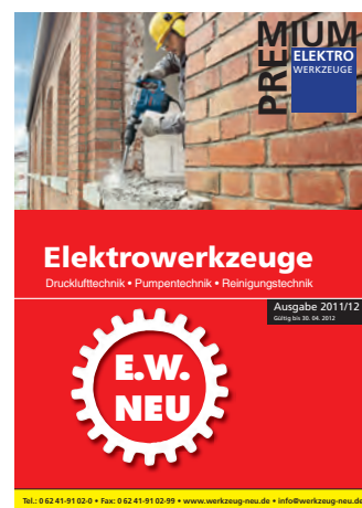
Premium Elektrowerkzeuge 2011/2012